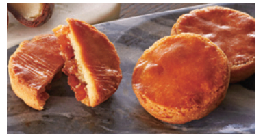
Pie de TUTUMU(シュクレ)