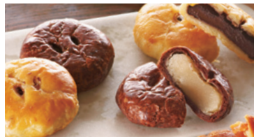
Pie de TUTUMU(プリゼ)