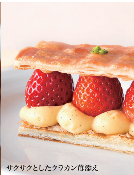
サクサクとしたクラカン苺添え