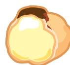
クリームブリュレ